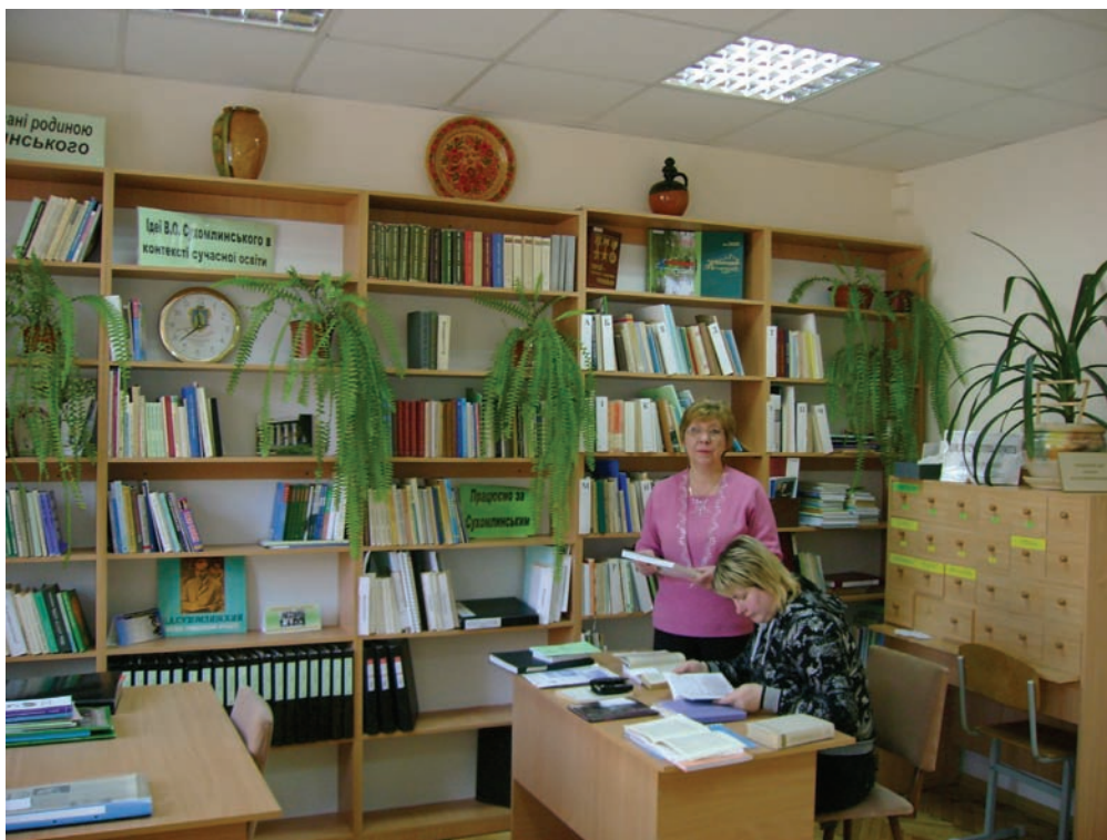
Читальний зал Фонду В. О. Сухомлинського в ДНПБ України ім. В. О. Сухомлинського (2009 р.)