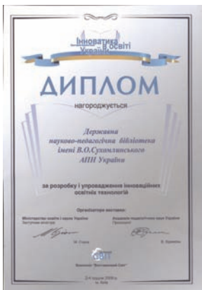
Диплом Міністерства освіти і науки України та Академії педагогічних наук України за розробку і упровадження інноваційних освітніх технологій від 2 грудня 2009 року