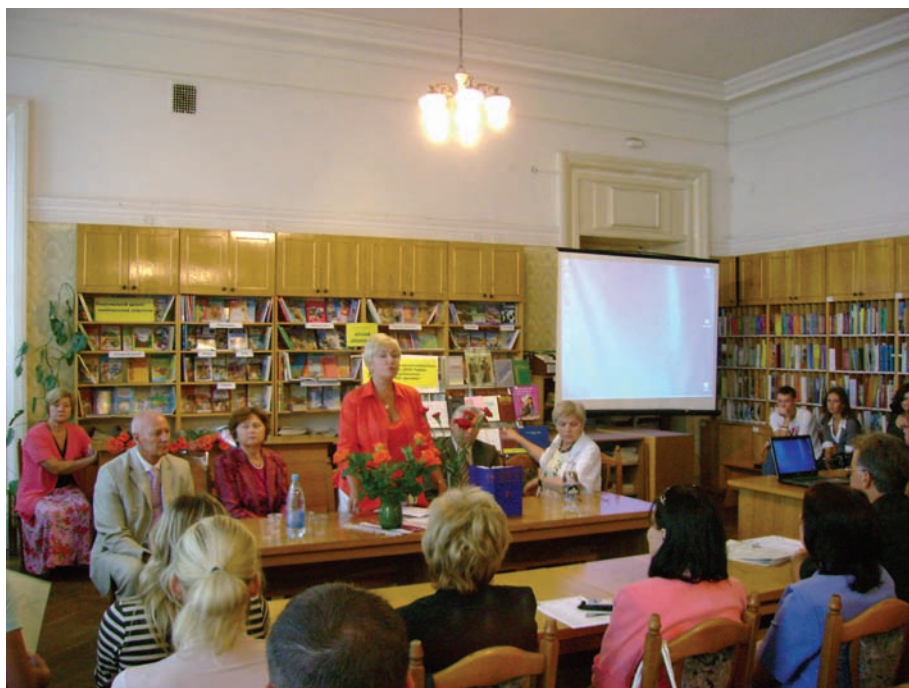
Презентація видання „Енциклопедія освіти” в читальному залі філії ДНПБ України ім. В. О. Сухомлинського, що розташована в Київському міському будинку вчителя. У президії зліва направо: директор Інституту вищої освіти АПН України, акад. В. І. Луговий, акад. АПН України О. Я. Савченко, директор ДНПБ України ім. В. О. Сухомлинського П. І. Рогова, директор Інституту проблем виховання АПН України, акад. І. Д. Бех, акад.-секретар Відділення Президії АПН України О. В. Сухомлинська (2008 р.)