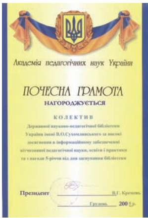
Почесна грамота Академії педагогічних наук України за високі досягнення в інформаційному забезпеченні вітчизняної педагогічної науки, освіти і практики та з нагоди 5-річчя заснування бібліотеки від грудня 2005 року