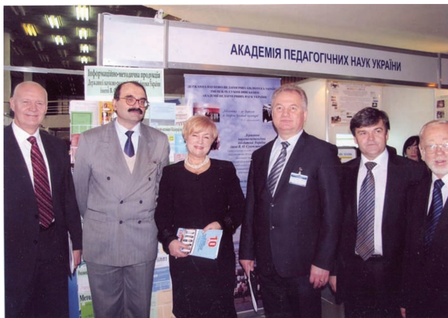
Виставка „Інноватика в освіті України–2009”. Зліва направо: директор Інституту вищої освіти АПН України В. І. Луговий, заступник міністра освіти і науки України М. В. Стріха, директор ДНПБ України ім. В. О. Сухомлинського П. І. Рогова, директор Інституту інноваційних технологій і змісту освіти МОН України О. А. Удод, ректор Переяслав-Хмельницького державного педагогічного університету імені Григорія Сковороди В. П. Коцур, начальник відділення змісту вищої освіти МОН України К. М. Левківський (2009 р.)