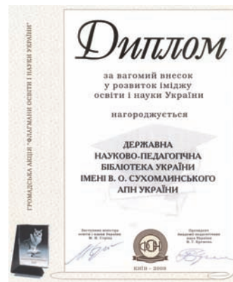
Диплом Міністерства освіти і науки України та Академії педагогічних наук України за вагомий внесок у розвиток іміджу освіти і науки України від 2009 року