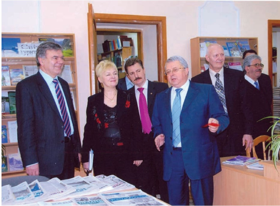
Відкриття читального залу в Науковій бібліотеці Національного педагогічного університету імені М. П. Драгоманова. Зліва направо: президент АПН України В. Г. Кремень, директор ДНПБ України ім. В. О. Сухомлинського П. І. Рогова, ректор НПУ ім. М. П. Драгоманова В. П. Андрющенко, директор Інституту вищої освіти АПН України В. І. Луговий та науковці НАН України і АПН України (2009 р.)