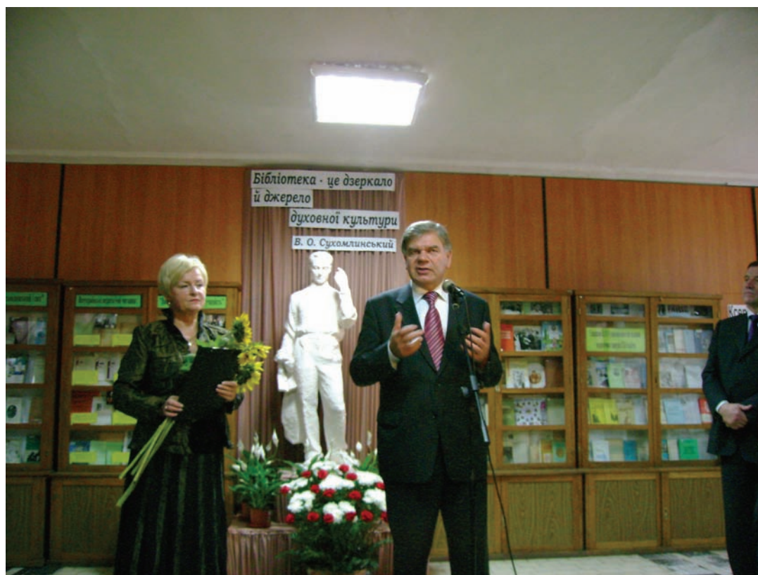
Президент АПН України, акад. В. Г. Кремень і директор ДНПБ України ім. В. О. Сухомлинського П. І. Рогова під час відкриття пам'ятника Василю Сухомлинському у вестибюлі бібліотеки (2008 р.)