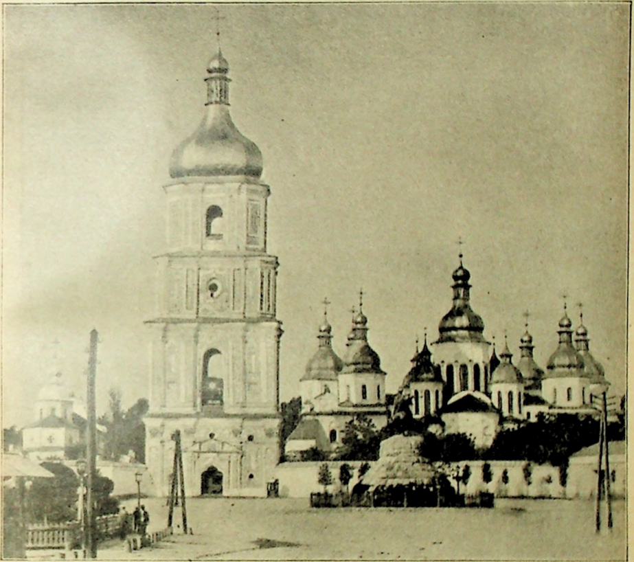
Собор св. Софії.

Кн. Володимир Великий мав багато синів і розділив тодішнім звичаєм Русь на уділи, котрі роздав між синів.