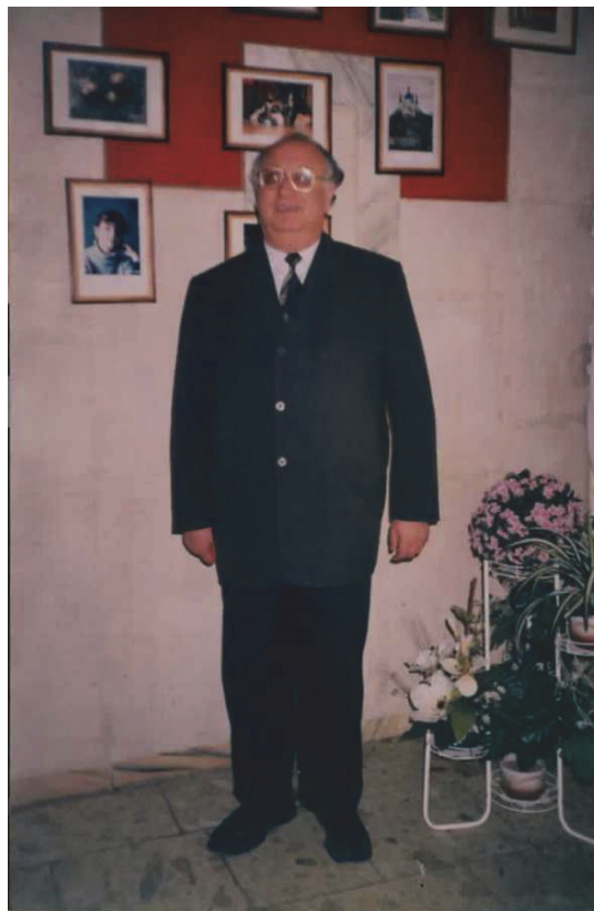
Жовтень 1995 р.