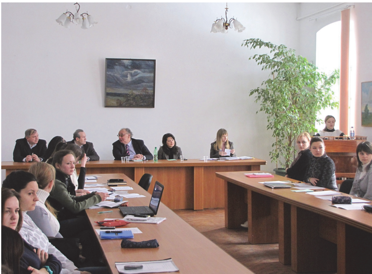
Всеукраїнська студентська конференція, 2011 р.