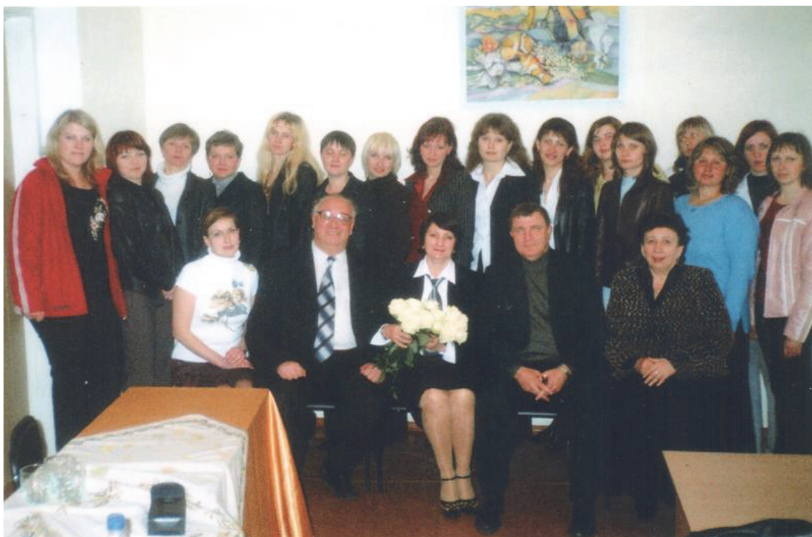
Після захисту дипломів. З випускниками, Кам'янець-Подільський, 2006 р.