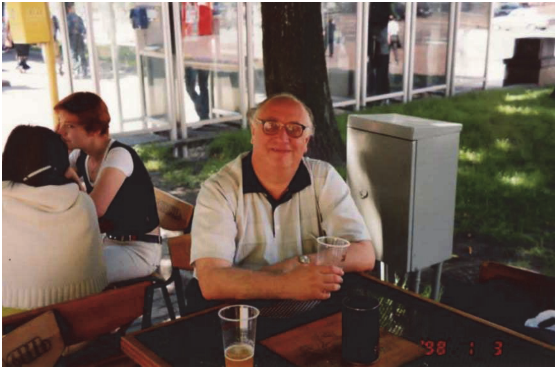
На відпочинку, літо 1998 р.