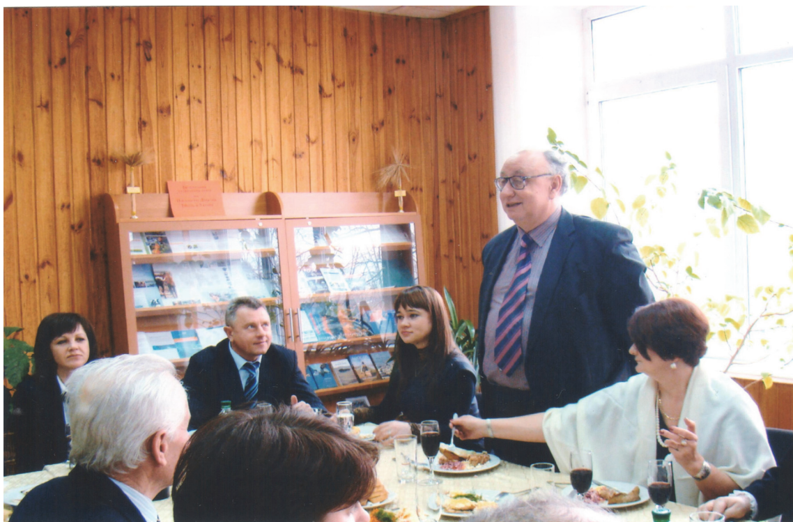
У Державній науковій сільськогосподарській бібліотеці НААН, 2010 р.