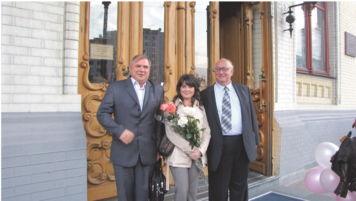
Посвята в студенти, 2010 р.