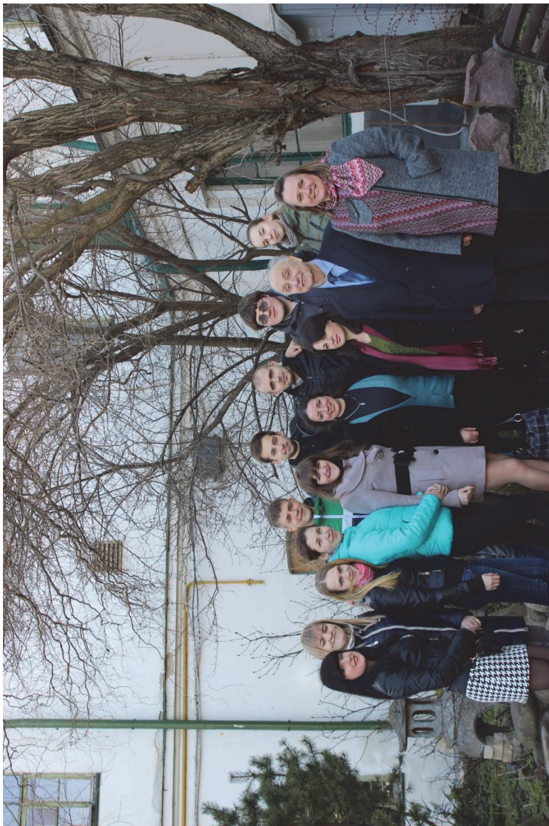
Національна академія керівних кадрів культури і мистецтв, студенти та викладачі кафедри, квітень 2015 р.