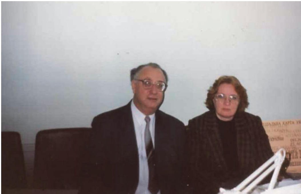
М.С. Слободяник та член-кореспондент НАН України Л.А. Дубровіна