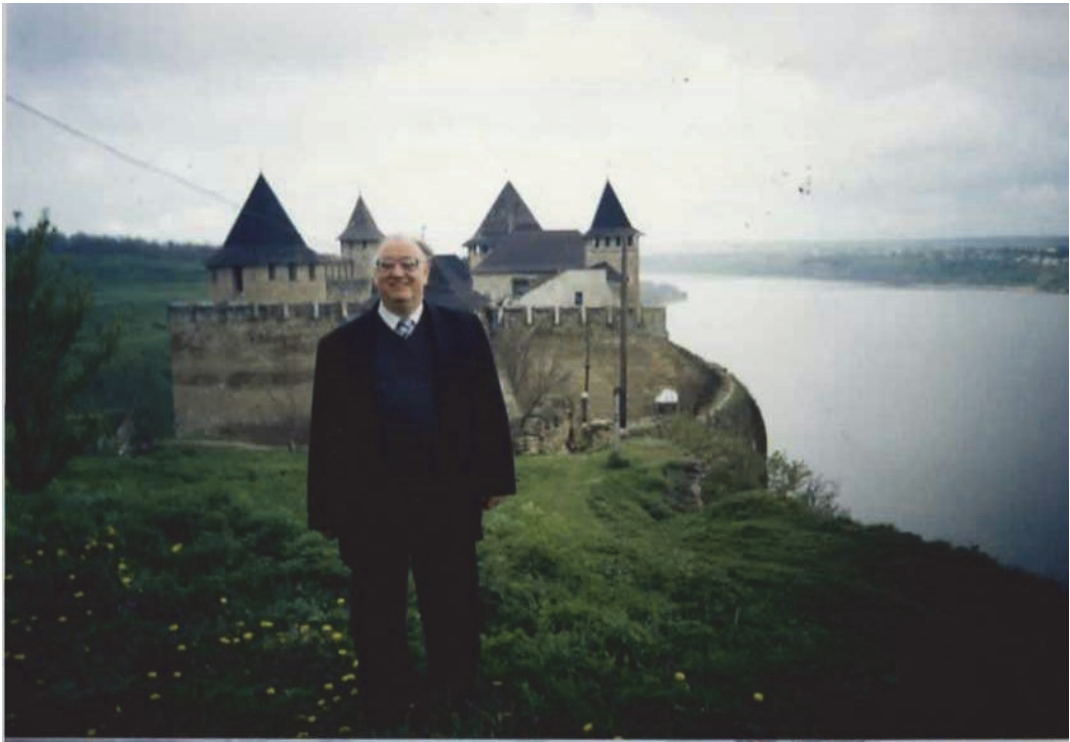
Хотин, 2005 р.