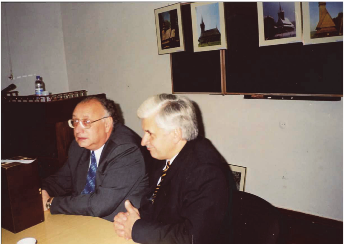
Кам'янець-Подільський навчально-консультаційний пункт, 2005 р.