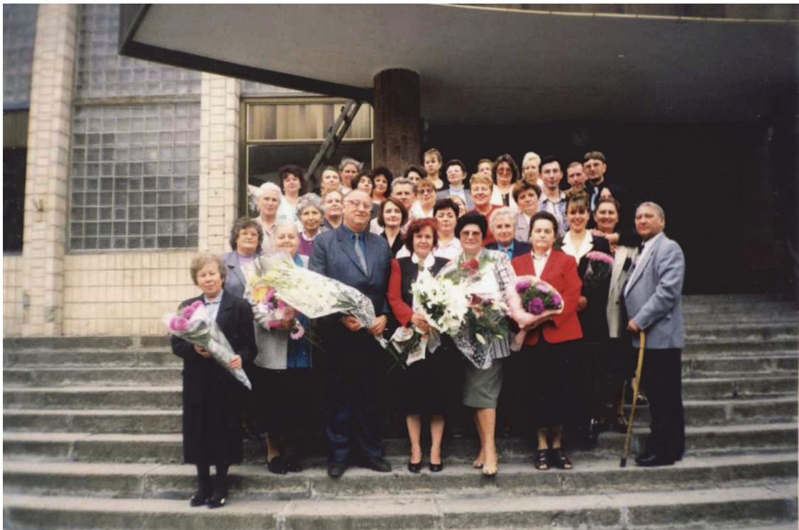
Ювілей у колі колективу Центральної наукової сільськогосподарської бібліотеки УАН та друзів, 1999 р.