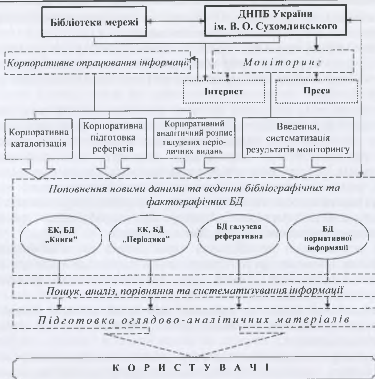
Рис. 2. Структурно-логічна схема системи інформаційно-аналітичного забезпечення інноваційного розвитку педагогічної науки, освіти і практики України Зокрема, інформаційно-аналітичне забезпечення передбачає підготовку:

• періодичних (щотижневих, щомісячних, шоквартальних, щорічних) матеріалів: бібліографічних, реферативних, аналітичних оглядів, дайджестів та ін.;