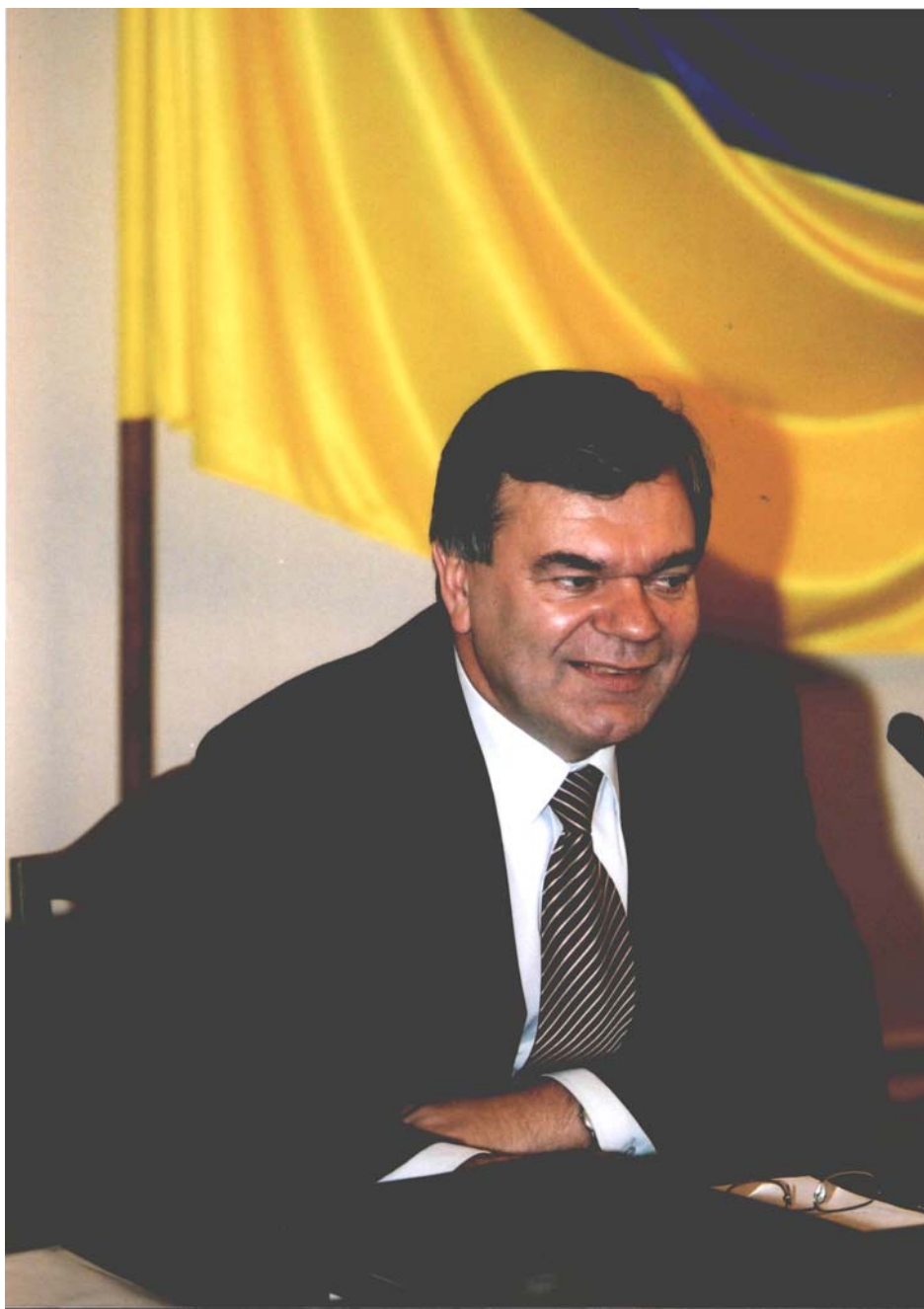
ВАСИЛЬ ГРИГОРОВИЧ КРЕМЕНЬ