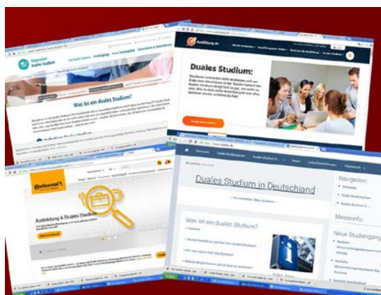
Рис. 4. Найбільш популярні сайти, на яких представлено всі дуальні спеціальності Німеччини

Wegweiser-Duales-Studium [Elektronische ressource]. – Textdaten. – [Bundesrepublik Deutschland], 2018. – Zugriffsmodus: https://www.wegweiser-duales-studium.de/ (Datum der Anfrage: 11.12.2018). – Titel vom Bildschirm.