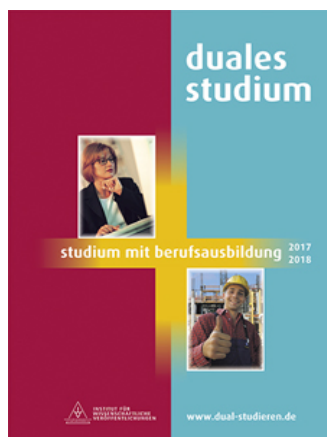
Рис. 3. Обкладинка журналу «Duales studium»

Duales studium : studium mit berufsausbildung. Ausgabe 2017/2018 / Institut für Wissenschaftliche Veröffentlichungen. – Hamburg, 2018. – 338 s.