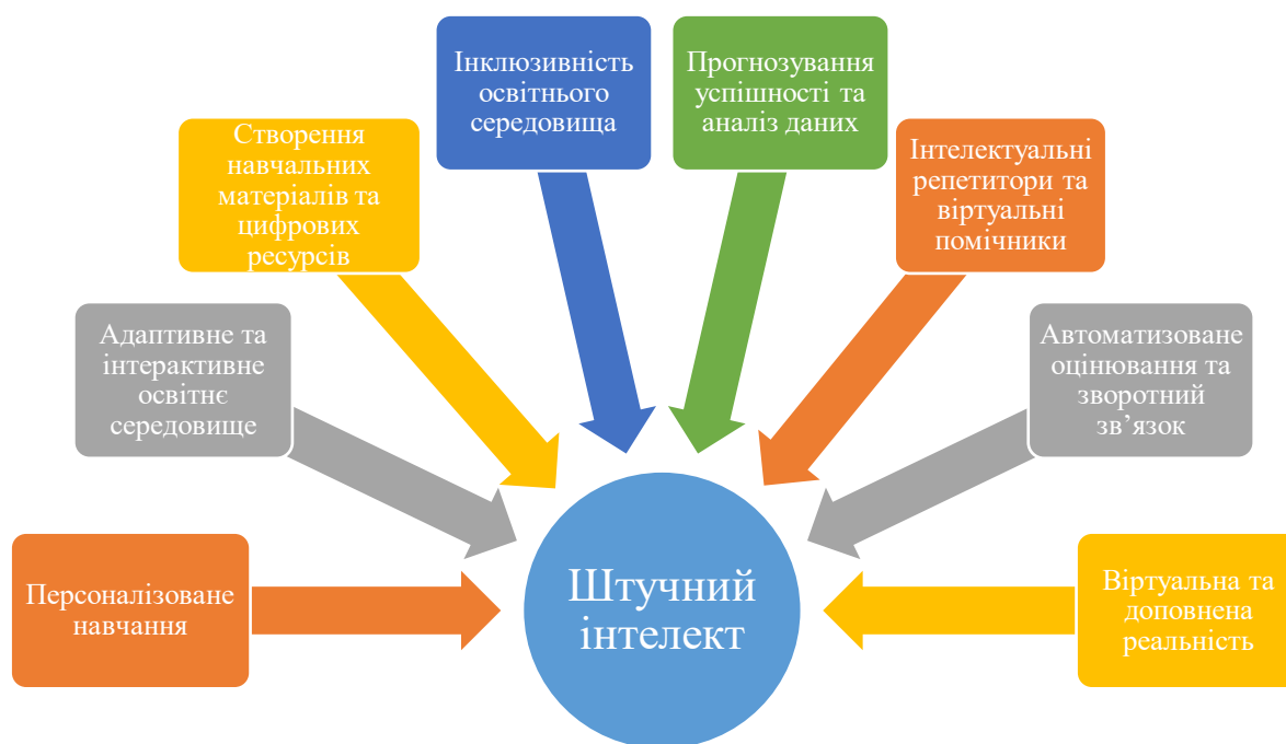
Рис. 1. Основні напрями та можливості використання ШІ в освіті

основні напрями використання штучного інтелекту як дієвого інструмента підвищення якості освіти (рис. 1).