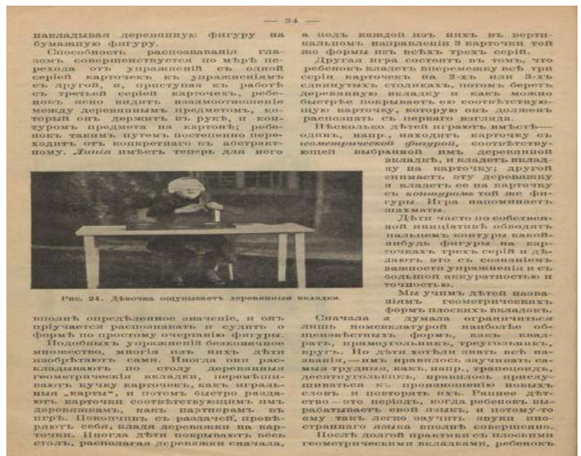
Рис. 24. Девочка оупушивает деревянные вкладыши.

У фонді ДНПБ України ім. В. О. Сухомлинського зберігаються й такі праці Марії Монтессорі: «Арифметика в детском саду» (1922) [11], що містить дидактичні матеріали з математики, особливості роботи з якими висвітлює Ю. Фаусек [31]; «Метод наукової педагогіки та практики його в Домах для дитини» (1913) [14] тощо. З іншими виданнями з фонду ДНПБ ви можете ознайомитись, перейшовши за посиланням https://dnpb.gov.ua/ua/informatsiyno-bibliohrafichni-resursy/vydatni_pedahohy/10350 .