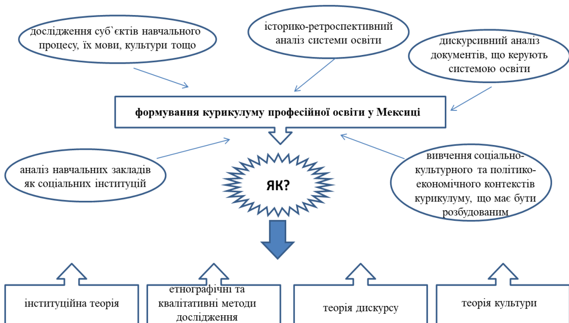
Рис. 2. Формування курикулуму професійної туристичної освіти у Мексиці

Висновки. Отже, інституційна теорія є основою формування курикулуму професійної освіти фахівців сфери туризму у соціально-критичній перспективі. Інституційний аналіз навчальних закладів та процесів, що в них відбуваються, є новим напрямом критичного розгляду освітньої галузі (див. рис. 2).