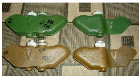
Міни натискувальної дії (фугасні)