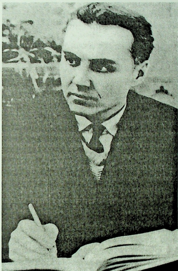
До 90-річчя від дня народження В.О. Сухомлинського (1918 - 1970)