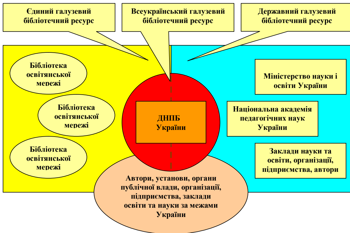
Рис.2. Концепція формування всеукраїнського бібліотечного галузевого ресурсу

У ДНПБУ розроблено та сформовано систему інформаційного забезпечення фахових потреб науковців і практиків освітянської галузі України, яка складається з бібліографічного, реферативного та аналітичного напрямів [16, с. 103]. Оптимізація аналітичної діяльності у галузі освіти пов'язана з використанням інформаційних систем і програмного забезпечення через застосування відповідних методів опрацювання інформації.