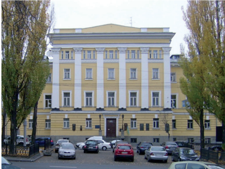
Будівля гуманітарного корпусу Київського національного університету імені Т. Г. Шевченка, де у 1919 р. розміщувалася довідково-педагогічна бібліотека Наркомосу