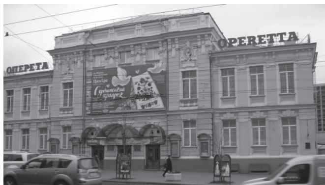
У будівлі колишнього Народного дому Київського товариства грамотності, у структурі якого у 1896 р. були засновані зібрання посібників у справі народної освіти та музей наочних посібників, нині знаходиться Київський академічний театр оперети