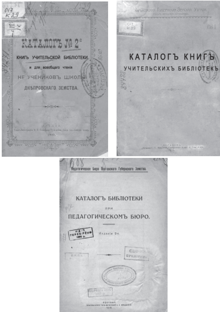
Каталоги учительських та довідково-педагогічних бібліотек, що діяли при Дніпровському, Харківському та Полтавському губернських земствах у другій половині XIX ст.