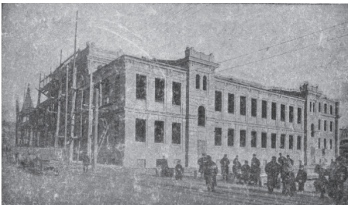
Будівництво Народного дому Київського товариства грамотності на Троїцькій площі м. Києва (1901 р., архітектор Г. Антоновський)