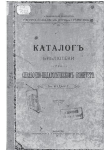
Каталоги довідково-педагогічної бібліотеки, яка була заснована у структурі Харківського товариства поширення в народі грамотності