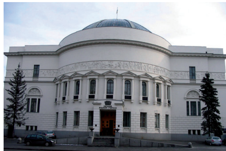
Педагогічний музей м. Києва, в якому містилася довідково-педагогічна бібліотека (1912), що обслуговувала освітян м. Києва й Київської губернії.

З 1984 р. у цьому будинку (нині – Київський будинок учителя) розміщувалася спеціальна педагогічна бібліотека профспілки робітників освіти Робос, яку було засновано у м. Києві 1923 р. Нині тут знаходиться філія Державної науково-педагогічної бібліотеки України імені В. О. Сухомлинського АПН України, основою ресурсу якої є фонд зазначеної вище бібліотеки