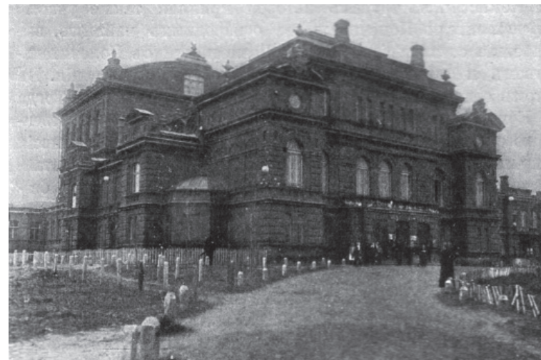
Народний дім Харківського товариства поширення в народі грамотності, у структурі якого вперше в Україні було засновано довідково-педагогічну бібліотеку поза навчальним закладом (1869)

ЦПНБ – Центральна педагогічно-наукова бібліотека